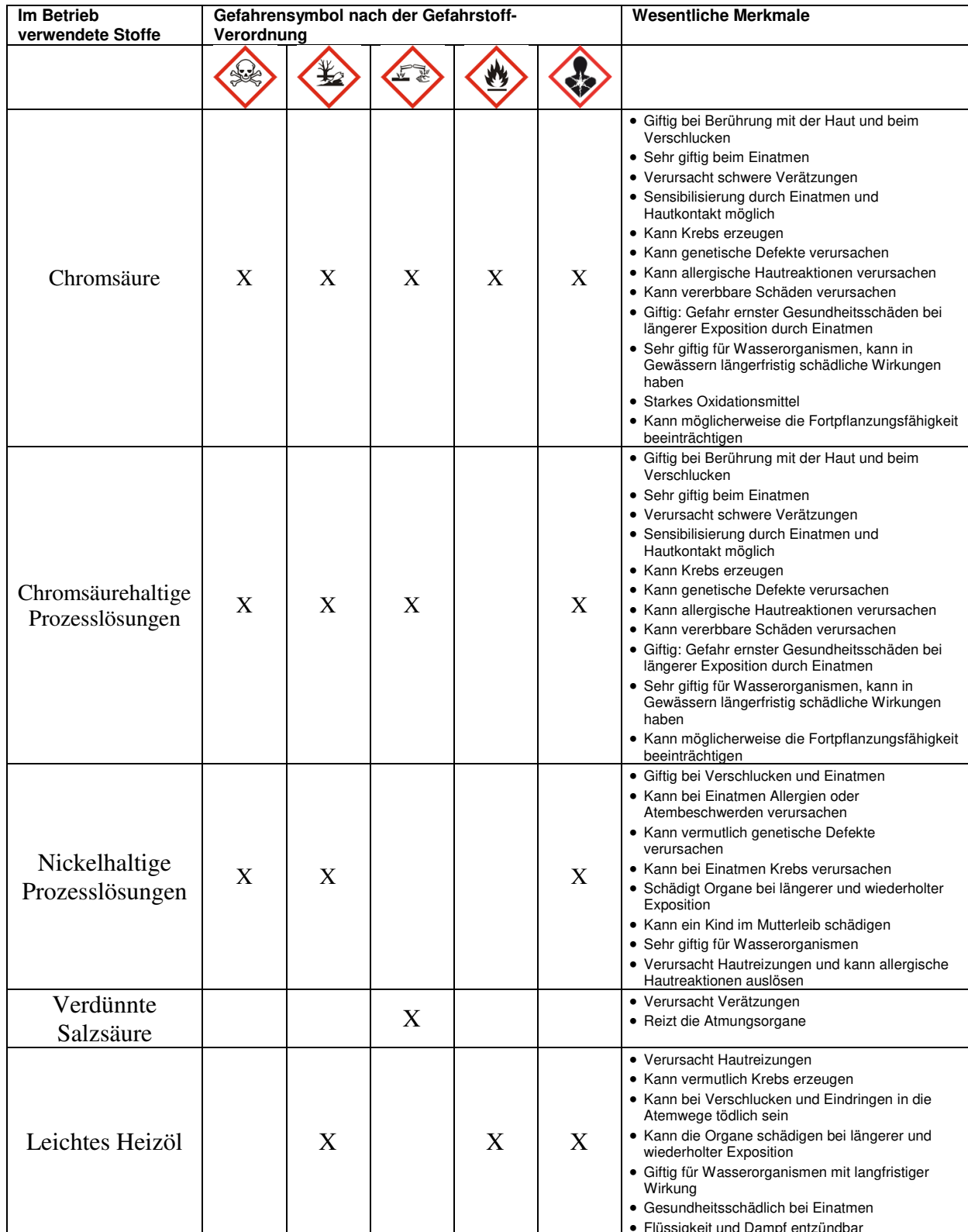
Tabelle mit den Gefahrstoffen, Gefahrensymbol und wesentliche Merkmale

Die gefährlichsten und mengenmäßig bedeutsamen Stoffe und Prozesslösungen werden nachfolgend aufgeführt: