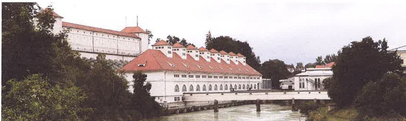
VERBUND-Laufkraftwerk Töging, Bayern